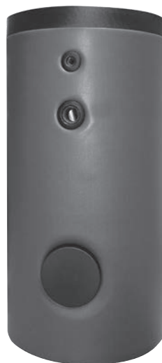
Modèle 800 l